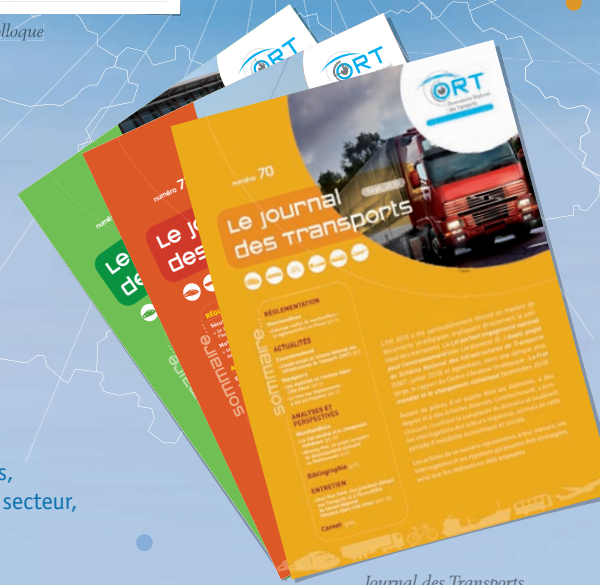
Journal des Transports